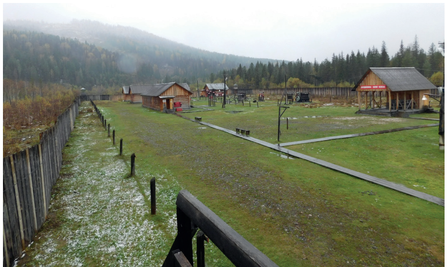
Лагерь-музей, посвященный памяти жертв политических репрессий

работу было практически невозможно. Детям, чьи родители обвинялись по политической статье, меняли фамилии, и позже они уже не могли друг друга найти. Жизнь не делилась на «до» и «после». Она рушилась: многих «съедали» не тяжелые бытовые условия, а психологическое напряжение, лагерный режим, бесчеловечное отношение.