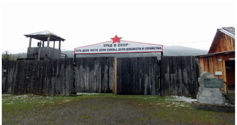
Центральный вход в музей-заповедник «Трехречье»

Судьба же тех, кому освободившись удалось покинуть ГУЛАГ, в дальнейшем тоже не складывалась: их считали врагами народа. Устроиться на хорошую