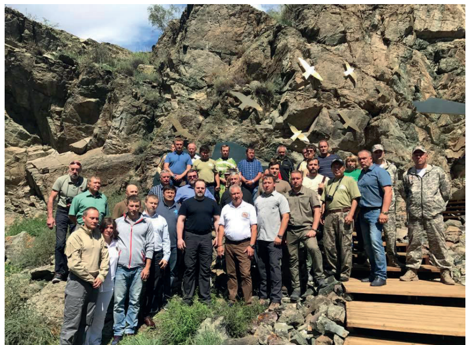
Участники церемонии открытия мемориала