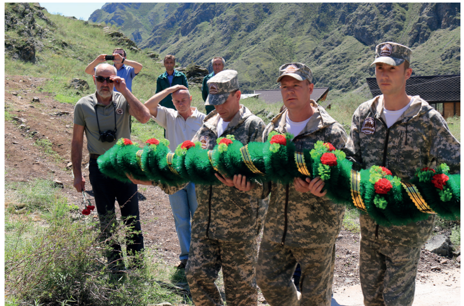
Госинспекторы Саяно-Шушенского заповедника отдают дань памяти погибшим коллегам