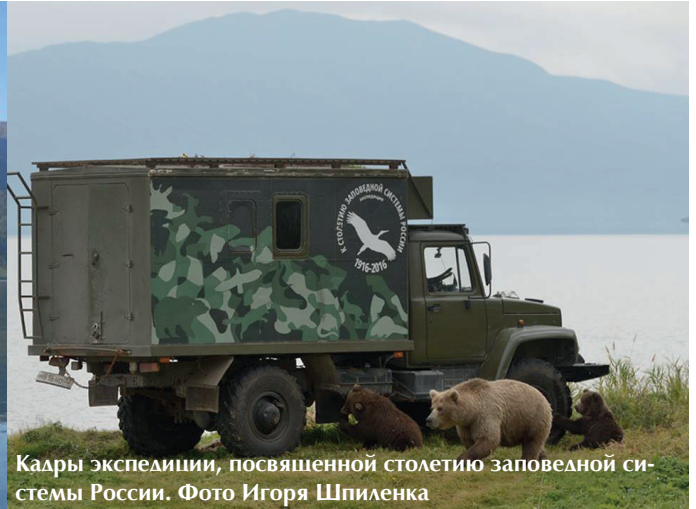
Кадры экспедиции, посвященной столетию заповедной системы России.

начально предназначался для сохранения соболя и успешно функционирует и в настоящее время.