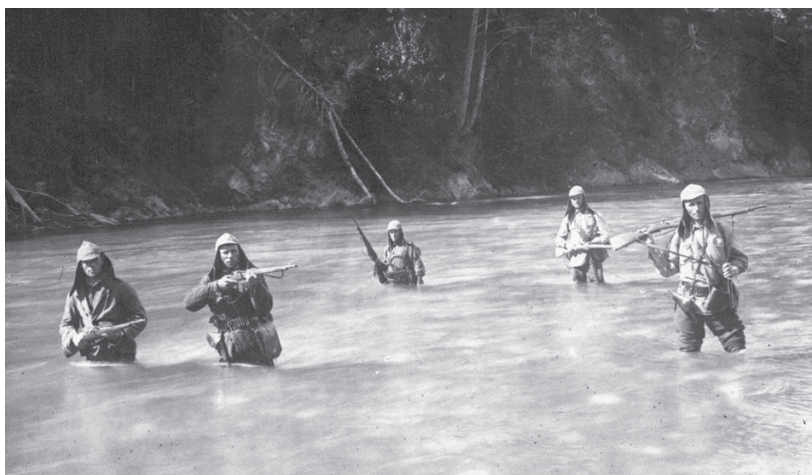
Становление заповедников. Рейд по борьбе с браконьерством и бандитизмом в Кавказском заповеднике. 1920-е годы.

Использованы материалы из презентации В.Б. Степанищкого «Государственное управление в сфере заповедного дела и минувший век: уроки и перспективы»