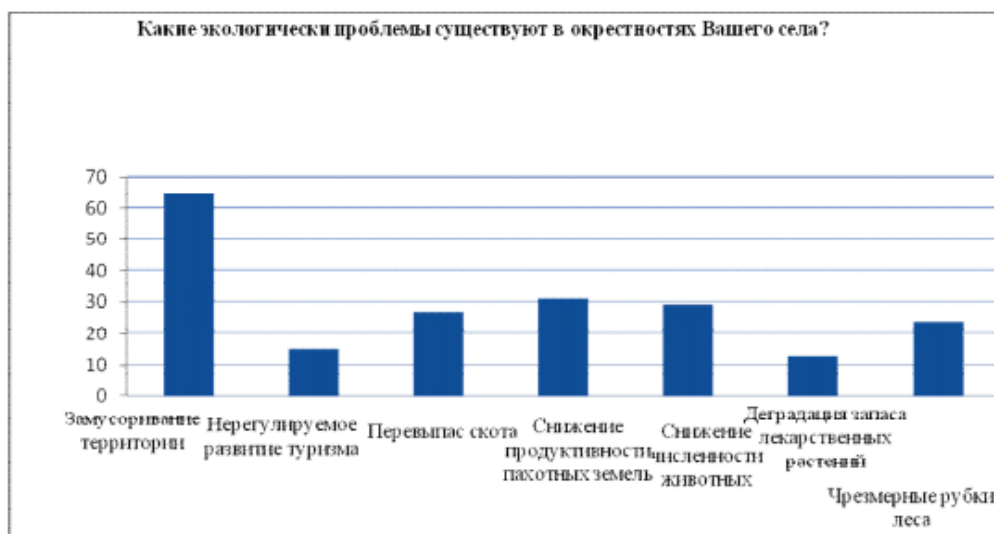
Рисунок 2 – Распределение ответов на вопрос о ключевых экологических проблемах в обследуемых селах

Основные источники экологического беспокойства населения определялись через частотность выбора респондентами наиболее острых с их точки зрения экологических проблем в районе. На основе полученного распределения ответов был построен рейтинг основных источников экологической тревоги населения обследуемых сел (Рис. 2).