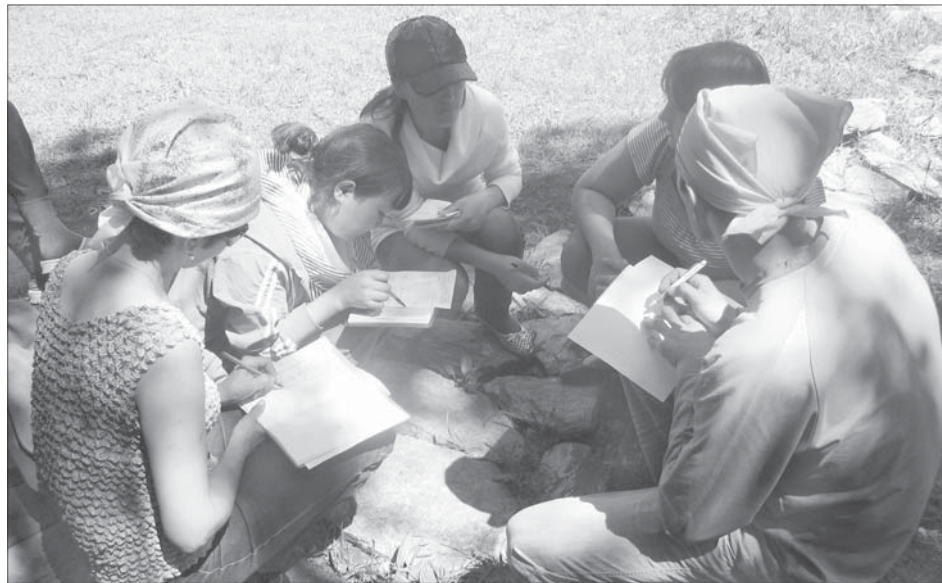
Участники тренинга изучают методику определения допустимых рекреационных нагрузок