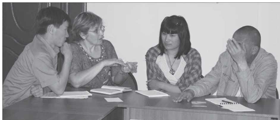
Во время тренинга