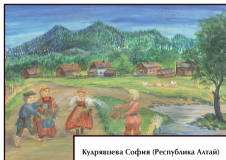
Куарьянцва София (Республика Алтай)