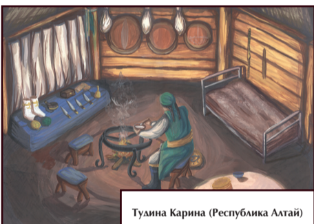
Туайна Карина (Республика Алтай)