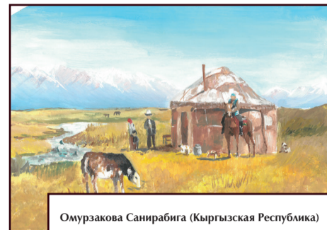
Омурзакова Санрабига (Кыргызская Республика)