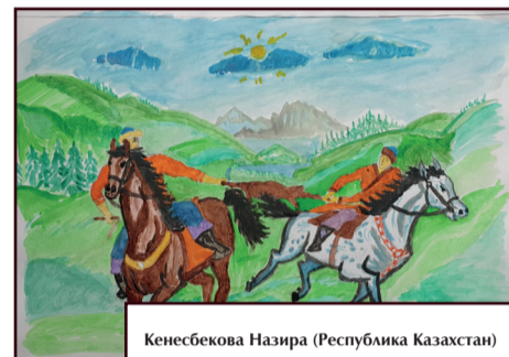
Кенесбекова Назира (Республика Казахстан)