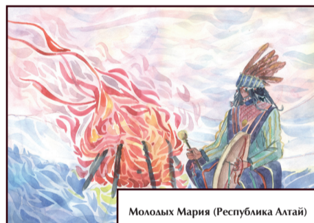
Молодых Мария (Республика Алтай)