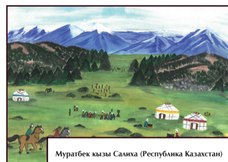
Муратбек кызы Салиха (Республика Казахстан)